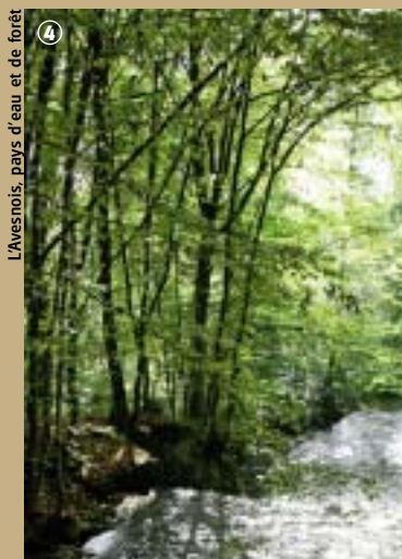
L'Avesnois, pays d'eau et de forêt

avèrent commodes à exploiter, de petites usines métallurgiques voient le jour car les gisements de minerai de fer ne sont pas loin : Féron, Glageon, Trélon et Ohain en abondent ! Ohain fut d'ailleurs un petit centre industriel actif perché sur les hauteurs avesnoises. Et oui, aussi incroyable que cela puisse paraître, ce village est le plus élevé de l'arrondissement après Anor. Il offre aussi une jolie perspective sur les bois voisins et son église ne manque pas d'allure !