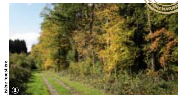
1 Lisière forestière