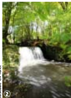
2 Cascade en forêt