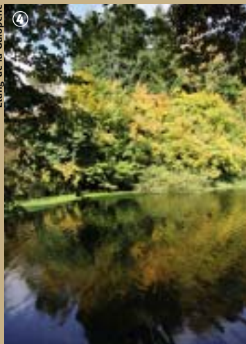
4 Étang de la Galopierie