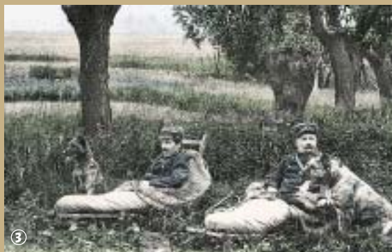
3 Douaniers dans leur lit de camp

Quand la contrebande se réinstalle en toute légalité, c'est la frontière franco-belge, entre Anor et Momignies, qui s'anime à nouveau autour de cette activité !