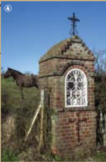
Chapelle au cœur du bocage

Rendez-vous est d'ores et déjà pris, chaque année, le troisième samedi du mois de mai, pour une promenade sous la voûte des deux hêtres pourpres de la Transylvestrie !