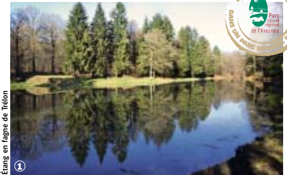
Étang en fagne de Trélon