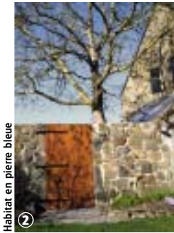
Habitat en pierre bleue