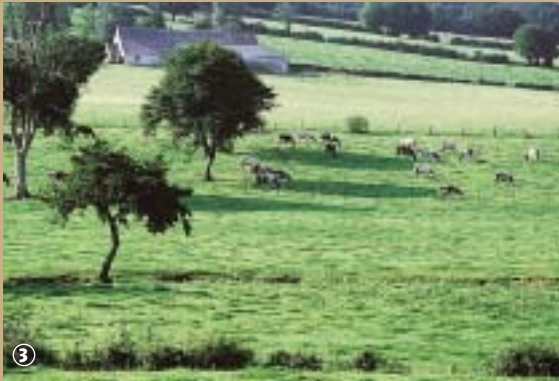
Le Valljoly et ses vergers traditionnels

Aller de découverte en découverte, à travers un paysage où se mêlent histoire et mémoire de deux pays voisins, ça vous tente ? En chemin entre France et Belgique, bienvenue sur la Transylvestrie ! En mai 2007, date de son inauguration, deux arbres jumeaux ont été plantés pour symboliser ce rapprochement de part et d'autre de la frontière.